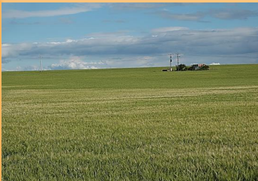
Parcela de cereal afectada