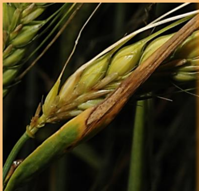
Manchas de aspecto aguanoso