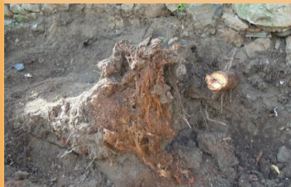
Tocón con orificios