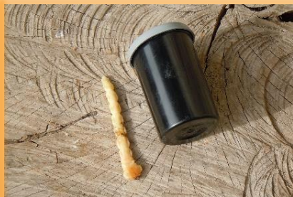
Tamaño de la larva