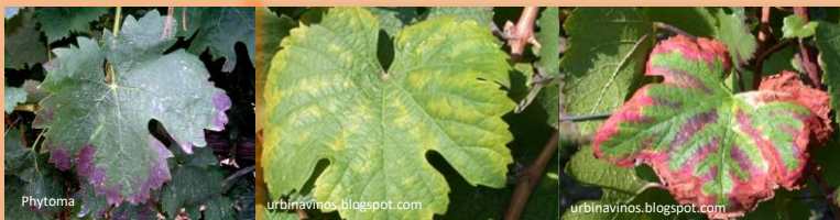
Síntomas en hojas