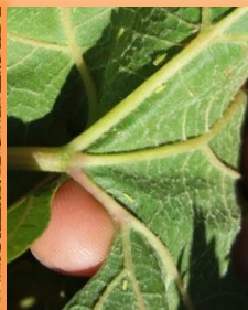
Mosquito en el envés