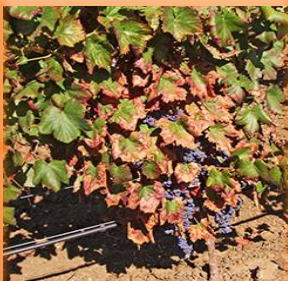
Daños en el viñedo