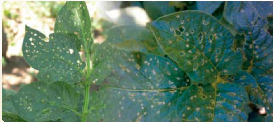
Daños en hojas (Estación Fitopatológica de Areeiro, Diputación Provincial de Pontevedra)

En ataques severos el daño causado por las larvas en las raíces puede provocar la muerte de las plantas . Las heridas producidas pueden ser vía de entrada para otros patógenos.