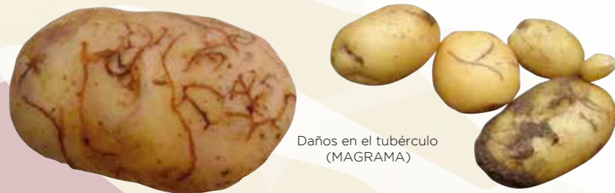
Daños en el tubérculo (MAGRAMA)