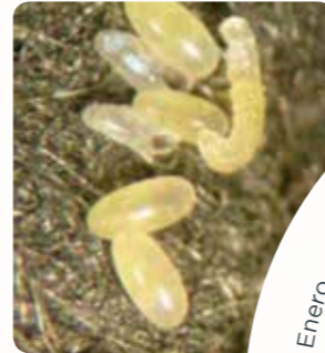
Puesta de huevos. (INIA - Oeiras)

Los huevos son de forma elíptica, miden 0,4 x 0,2 mm y su color es blanquecino tras la puesta, tornándose amarillo-grisáceo al acercarse la eclosión.