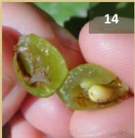
Hilos sedosos: glomérulos