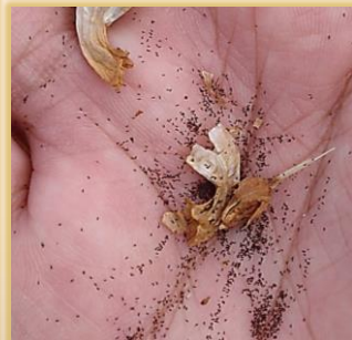
Tallos anclados en una raíz, emergencia y flores