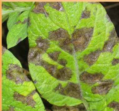
Hojas muy afectadas