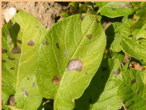
Síntomas de Alternariosis en hoja