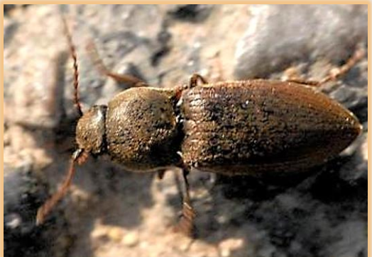
Adultos de Agriotes spp.