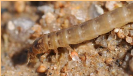
Larvas de gusano de alambre