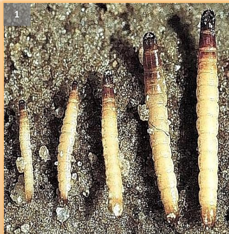
Distintas fases larvarias