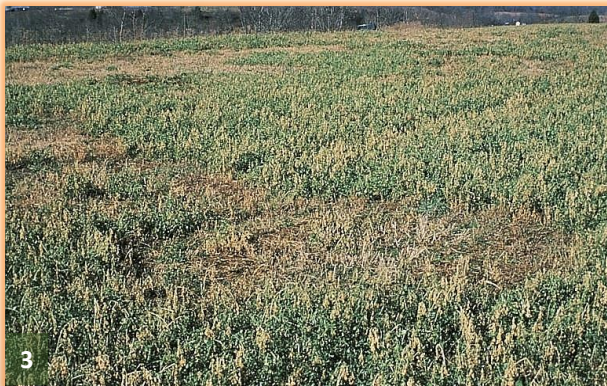
Rodales por mal vinoso