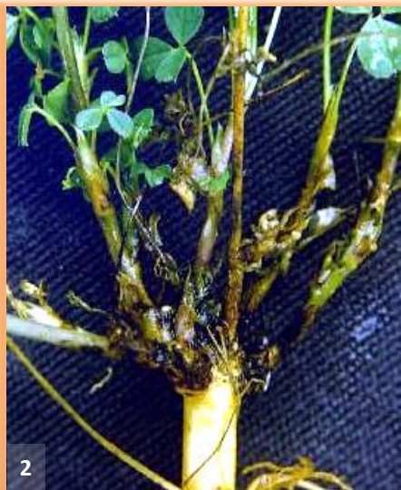
Pudrición a nivel del cuello