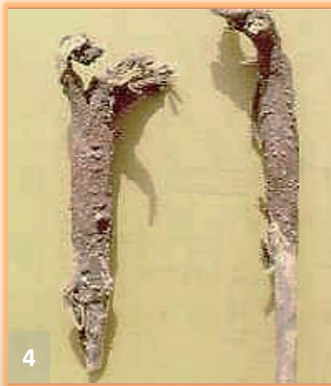
Síntomas en raíz