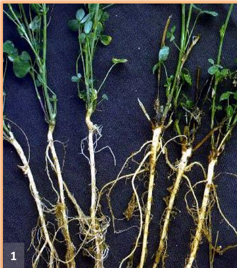
Plantas sanas frente a afectadas