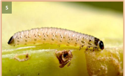
Arriba: pulguillas o alticas pequeñas ( Phyllotreta cruciferae , P. undulata y Podagrica sp.) Abajo: pulguilla o altica grande (adulto y larva de Psylliodes sp.)