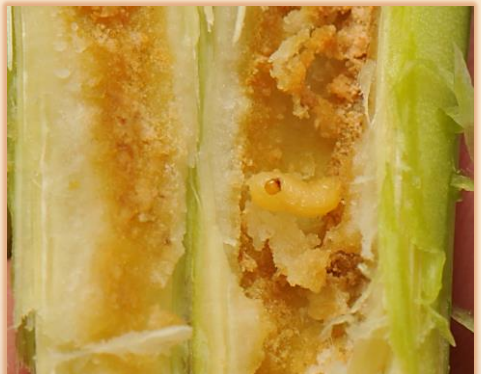
Arriba: adultos. Debajo: larvas (derecha, detalle de daños en la sección del tallo)