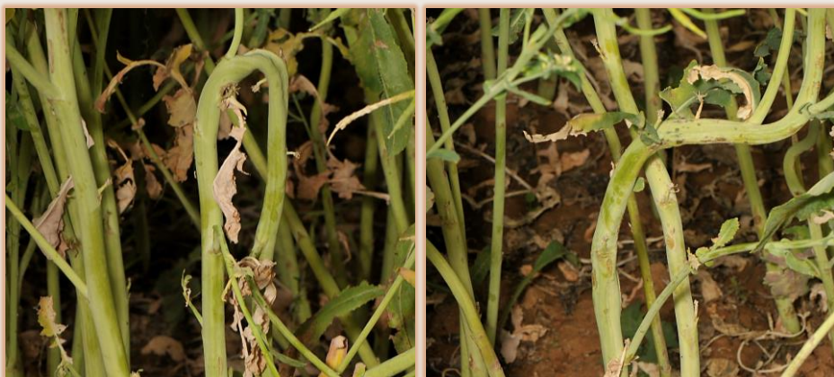
Sintomatología exterior en tallos