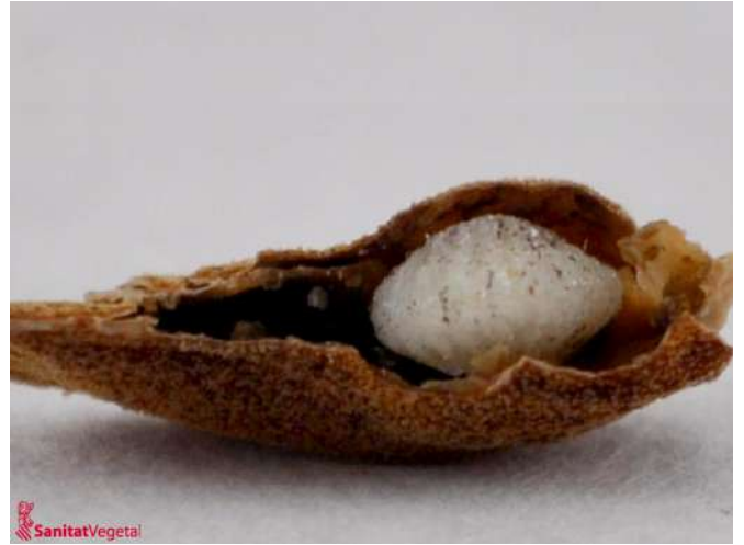
Larvas en el interior de la semilla. Se observa que ésta ha sido consumida totalmente

Al final del invierno las larvas se transforman en pupas y después en adultos, que perforan un orificio por el que salen al exterior, comenzando la puesta en pocas horas.